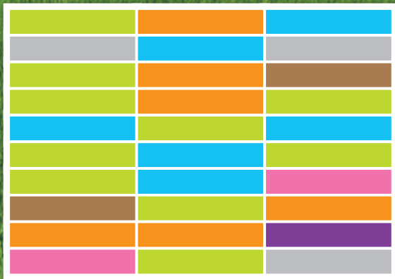
分散した農地利用