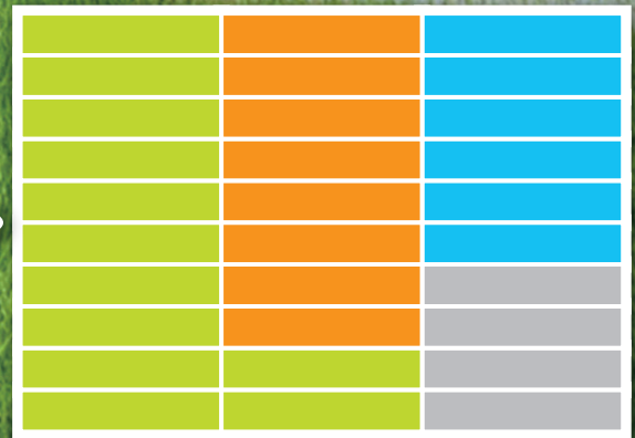
集約化した農地利用